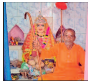
शीतला, देवी मंदिरों व घरों में अखंड दीप प्रज्वलित, मातारानी की सेवा में जुटे भक्त