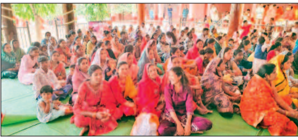
हरिभूमि न्यूज नगरी