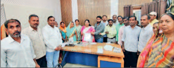
हरिभूमि न्यूज नगरी