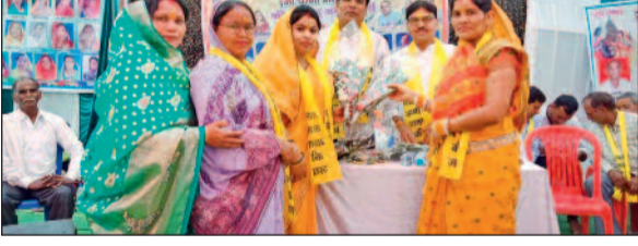
हरिभूमि न्यूज कोर्रा(मखार)

परिक्षेत्र साहू समाज कोर्रा के तत्वावधान में होली मिलन वार्षिक उत्सव मां कर्मा जयंती का आयोजन किया गया। माताओं द्वारा भव्य कलश यात्रा के साथ पूरे ग्राम में भ्रमण किया गया। मुख्य अतिथि अंबिका साहू विधायक धमतरी थे। अध्यक्षता रंजना साहू पूर्व विधायक ने की। विशिष्ट अतिथि लेखराम