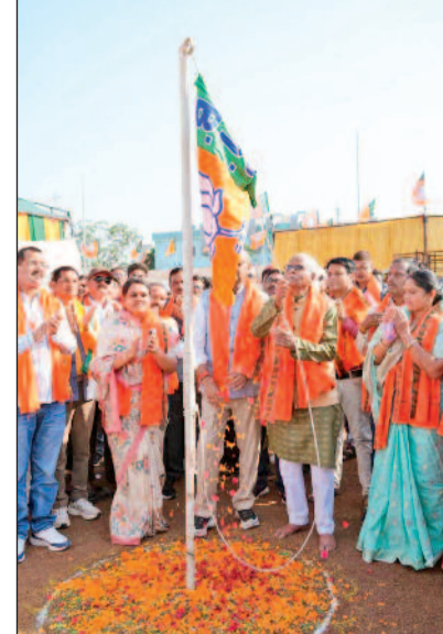
हरिभूमि न्यूज कुरुद